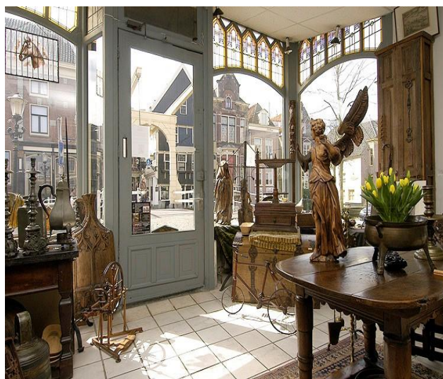
De winkel in 2006