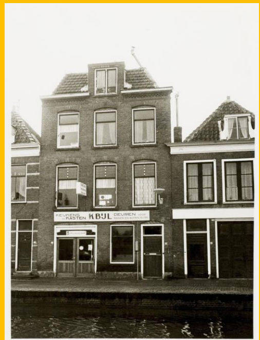
Luttik Oudorp 37-39, K.Bijl, Keukens, deuren en kasten, 1974

Ben volgde de kleuterschool op het Schaepmanplein en ging daarna naar de Vondelschool. 'Ik was uit de kluiten gewassen en nergens bang voor. Dus toen mijn oudere broer in de hoek gedreven werd, vloog ik eropaf. Ik deelde rake klappen uit. Toen was ik de big boy van de school. Bij de jongens, maar zeker ook bij de meisjes.'